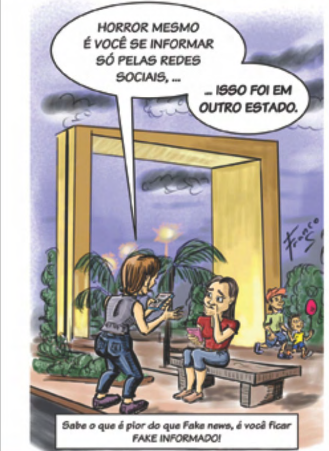
Sabe o que é pior do que Fake news, é você ficar FAKE INFORMADO!