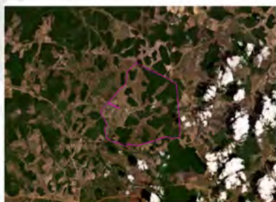
Recorte da Imagem Planisférico 4-band Scale X12 preview Data: Mon, 02/03/2026 02:02

Documento Assinado Eletronicamente por NEIVA PIMENTEL TRAJANO, Proprietária do Imóvel em 24/03/2026 às 13:25 A autenticação do documento pode ser conferida no endereço: https://validacao.femarh.ror.br/ValidarLicenca.php?codAut=83453 informando o seguinte código verificador: 83453 Informações para Contato: Email: gabinete@femarh.ror.br; Telefone: (93) 98410-5459